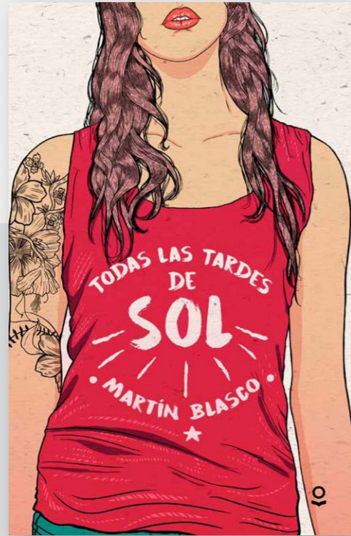
Todas las tardes de sol de Martín Blasco.