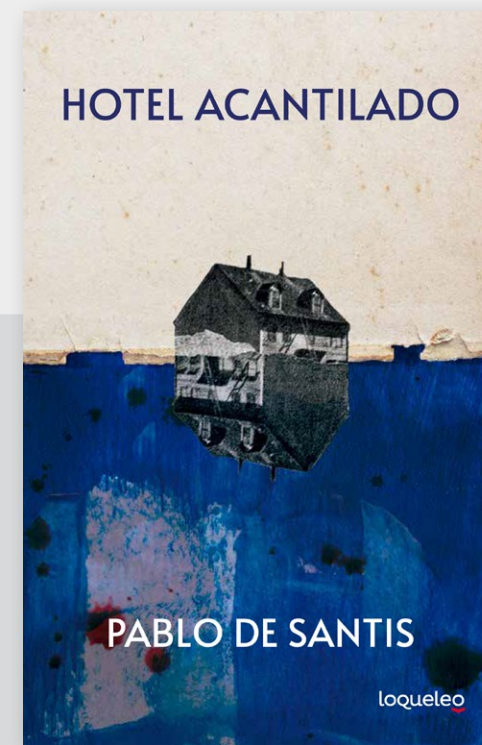
Hotel Acantilado de Pablo De Santis.

Íntima, sutil y conmovedora, una de las novelas más prestigiosas de la literatura argentina que las nuevas generaciones no deben dejar de leer. Para conocer nuestro pasado y poder construir un nuevo mundo.