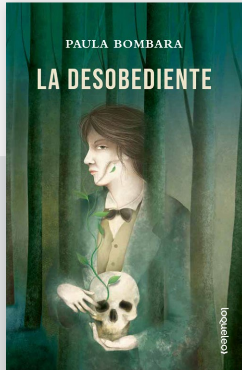
La desobediente de Paula Bombara.